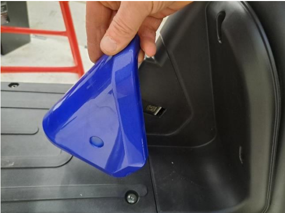
Ota oikeapuoleinen suojamuovi pois.