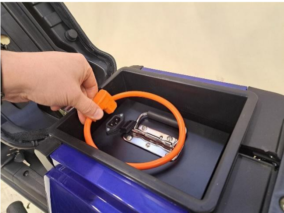
Irrota akun pistoke.