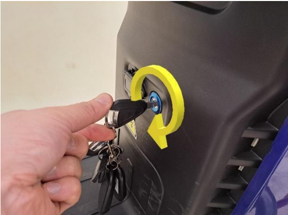
Avaa penkin lukitus.