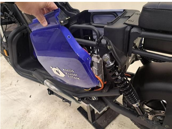
Ota istuimen vasemmanpuoleinen alasivumuovi pois.