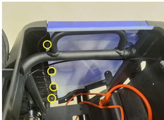
Irrota istuimen oikeapuoleisen alasivumuovin kiinnitysruuvit (ristipäämeisseli ph2).