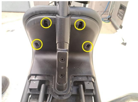
Irrota jalkatilan etuosan muovin kiinnitysruuvit (ristipäämeisseli ph2).