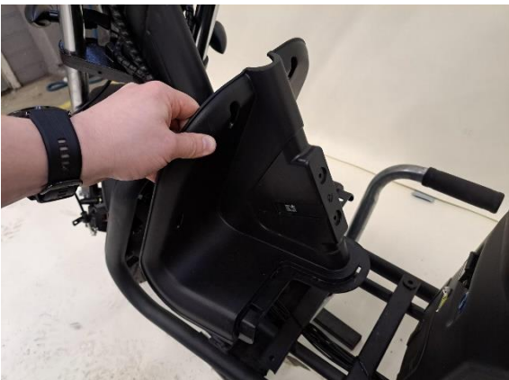
Ota jalkatilan etuosan muovi pois.

Uuden osan asennus käänteisessä järjestyksessä.