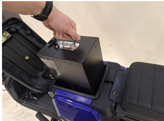
Nosta akku pois.