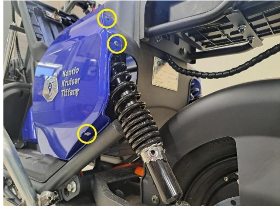
Irrota istuimen vasemmanpuoleisen alasivumuovin kiinnitysruuvit (ristipäämeisseli ph2).