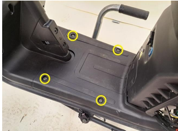
Irrota jalkatilan muovin kiinnityspultit (kuusiokoloavain 5 mm).