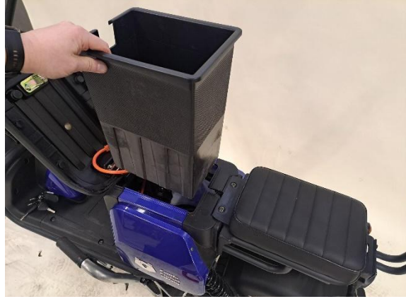
Nosta akkukotelo pois.