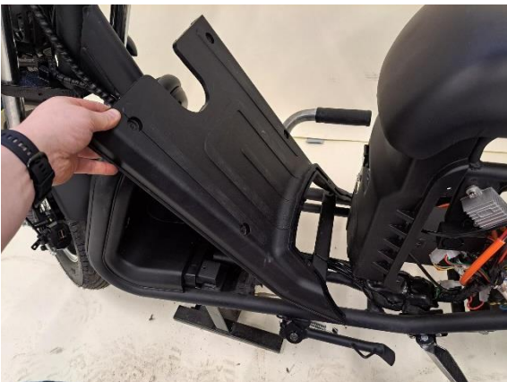
Ota jalkatilan muovi pois.