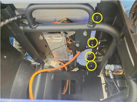
Irrota istuimen vasemmanpuoleisen alasivumuovin kiinnitysruuvit (ristipäämeisseli ph2).